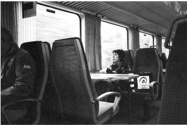
Mercedes Wandel, 72, auf dem Rückweg vom Besuch der Tochter in Luzern nach Küsnacht am Rigi.