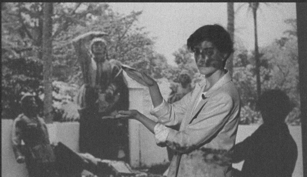
Filipa César reflektiert in ihren Filmen (hier Cacheu ) die portugiesische Kolonialzeit. © Filipa César, Courtesy Cristina Guerra Contemporary Art und die Künstlerin

Eine Unbekannte ist sie nicht. Filipa César kehrt mit der Einzelausstellung Single Shot Films nach St.Gallen zurück. Vor sechs Jahren beteiligte sie sich an der Sommerausstellung Im Auge des Zyklons im Kunstmuseum. Der Filmloop La Sortie du Cinéma der 1975 in Portugal geborenen und heute in Berlin lebenden Künstlerin steuerte einen überzeugenden Beitrag zum Ausstellungskonzept des in den Nuller-Jahren beliebten Begriffs «Entschleunigung» bei. In einer ungeschnittenen Einstellung nahm die Kamera den Eingangsbereich eines Pariser Kinos auf. Das daraus entstandene filmische Vexierbild versteht sich als Untersuchung über das Verhältnis von Realität und Fiktion im Kino und schlägt einen Bogen bis zu den Anfängen der Kinematografie, als die Gebrüder Lumière den Film eines Fabriktores mit herausströmenden Arbeitern auf die Leinwand brachten. Filipa César stellt mit ihrer künstlerischen Praxis die Übereinkünfte, wie im Film Geschichten erzählt werden, in Frage und reflektiert oft und gerne das Medium Film selbst.