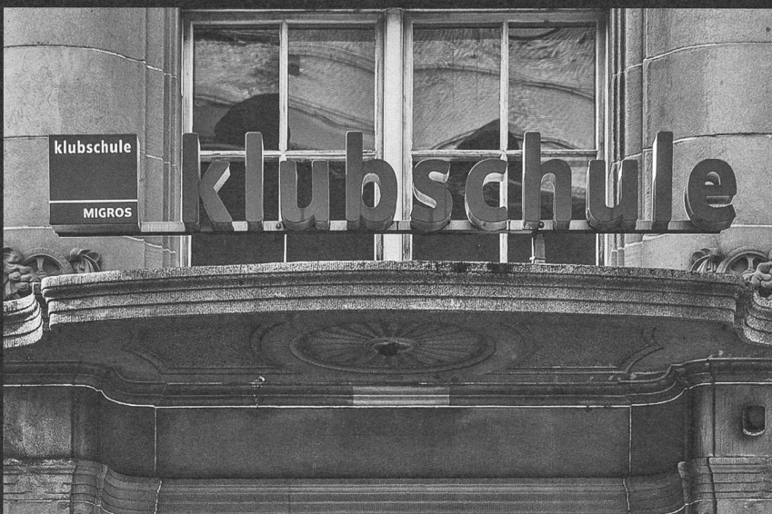
Die Türen zum Kulturprozent: Betriebszentrale in Gossau, Kulturbüro und Klubschule in St.Gallen.