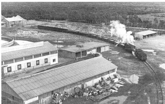
1937: Erste Zementfabrik der Schmidheins in Kapstadt.

Anfang der 1980er-Jahre wunderte ich mich, dass unter den im Lehrerzimmer der Kantonsschule Trogen aufliegenden Zeitschriften eine Broschüre von Blochers «Arbeitsgruppe Südliches Afrika» zu finden war, in der lobend erwähnt wurde, wie die weisse Regierung für die Schwarzen in Soweto schöne neue Häuschen baue. Heute kann ich mir vorstellen, wie es dazu kam.