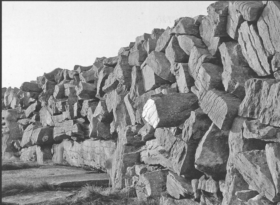
Eine der drei gelben Landmarken.

Steinerne Landschaft, grau in grau, nackte Felsen, aufgetürmte Steinmauern. Am weiten Horizont verliert sich das Meer. Nirgends eine Spur von Menschenwerk. Wer sich hierher verliert, muss sich sehr allein vorkommen.