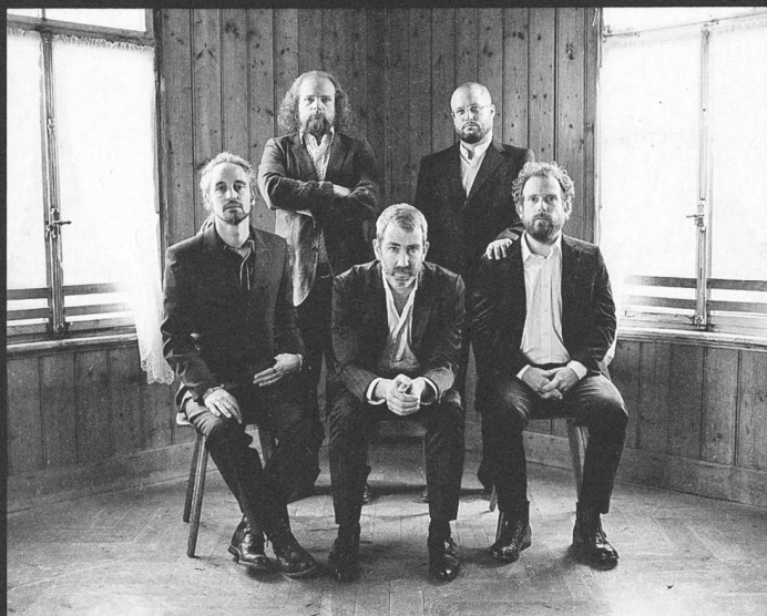
Flowiler? Uzwiler? Stahlberger!