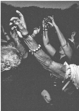
Ostschweizer Kulturmagazin Nr. 253, Februar 2016