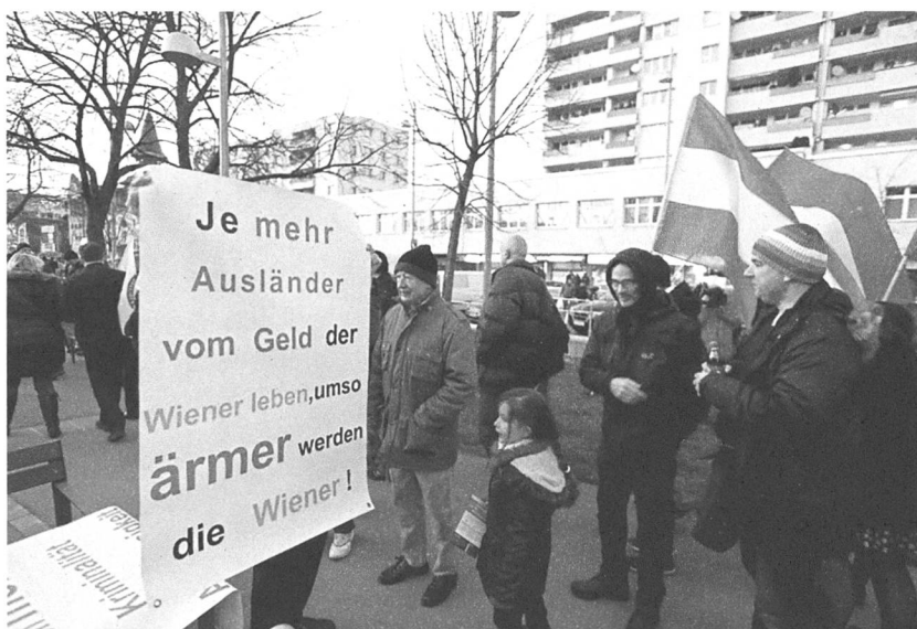
Demo und Gegendemo am 14. März in Wien.

Ferner lernt das Kind, das zu wenig Liebe erfährt, schon ganz früh, den Erwartungen der Eltern zu entsprechen, um eine Bindung mit ihnen zu haben. So akzeptieren Heranwachsende das verzerrte Selbstbild, welches Eltern von sich haben, und nehmen es als real wahr. Hier spielen unerfüllte Wünsche der Eltern eine Rolle. Die nichtgehabte oder verpasste Chance des eigenen Lebens soll vom Nachwuchs nun kompensiert und gelebt werden. Der Preis für diesen psychologischen Kraftakt ist ein verneintes Selbst und ein Verlust der Empathie in unterschiedlichen Schweregraden.