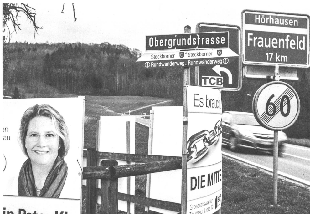
Vor lauter Mitte erschwerte Sicht: Wahlplakate und andere Hinweise im Thurgau.

Hier die Prognose für die Thurgauer Grossratswahlen am 10. April 2016: Es wird nicht viel passieren.