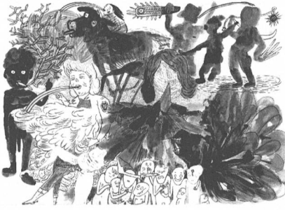
Ostschweizer Kulturmagazin Nr. 260, Oktober 2016