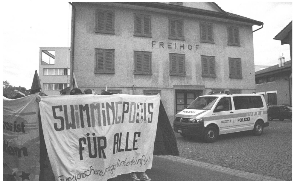
Mörschwiler Stilleben.

Zurück zu den Behörden, den Mörschwilern diesmal. Wer dort eine Demo veranstalten will, prallt auf ein besonders hartes Regime. Zumindest wenn es sich um eine Solidaritätsaktion für Geflüchtete handelt. Der Umzug habe geordnet und zügig abzulaufen, ohne ehrverletzende oder unanständige Äusserungen (schriftlich oder verbal), ohne unnötigen Lärm, ohne Megafone oder sonstige Verstärker und nur auf öffentlichem Grund, hiess es in der Vorschau auf saiten.ch . Mörschwil, das ist jene St.Galler Gemeinde, die die tiefsten Steuern im Kanton hat und die Jahresrechnung 2015 trotzdem mit 3 Millionen Ertragsüberschuss abschliesst. Und es nicht – oder erst auf Druck von aussen – fertig bringt, mehr als drei Duschen für die knapp 30 Geflüchteten im «Edelweiss» zu Verfügung zu stellen. Hier der Text und die Bilder dazu: saiten.ch/megafone-verbotten/ .