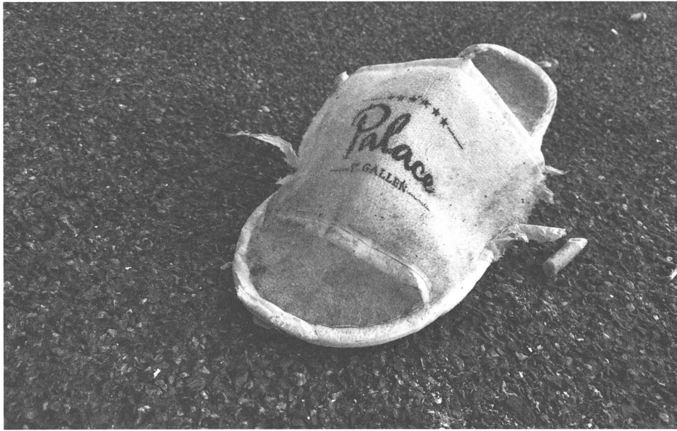
Palace-Finken. Gefunden am 24-Stunden Jubiläumfest am 25. September, morgens um 8.

Der Gast hat das Recht, dass er schnell zu seinem Bier kommt. Dass die Band pünktlich beginnt. Dass die Band mindestens 70 Minuten spielt. Dass es laut genug ist, aber nicht zu laut. Dass die Band all ihre Hits spielt. Und sauber muss es sein.