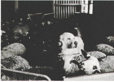
Ostschweizer Kulturmagazin Nr. 265, März 2017