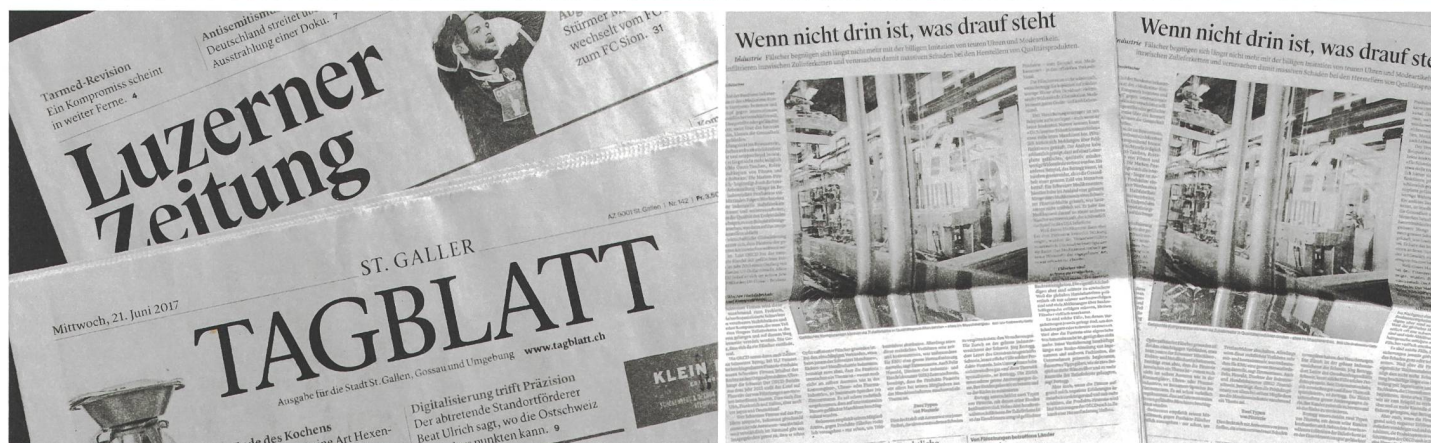
Identisch im Mantelteil: «St.Galler Tagblatt» und «Luzerner Zeitung», hier Titel und Seite 3 der Ausgabe vom 21. Juni.