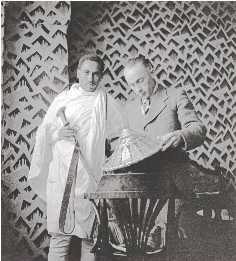
Abessinienflug 1934: Abessinischer Knabe wird fotografiert – Übergabe von Schild und Degen an Walter Mittelholzer.

Das frühe 20. Jahrhundert war eine Zeit der Flugpioniere, der abenteuerlichen Flugrekorde von jungen Männern mit wenig erprobten, riskanten Geräten: 1909 überflog Louis Blériot als erster Mensch den Ärmelkanal, 1913 überquerte Oskar Bider die Pyrenäen und dann die Alpen hin und zurück, 1927 flog Charles Lindbergh von New York nach Paris, ohne unterwegs zu landen, er würde auf einen Schlag weltberühmt.