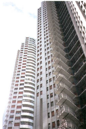
Michael Bodenmann, 1978, ist Fotograf und lebt in Zürich und St.Gallen. Er fotografiert zurzeit in Buenos Aires, wo er für ein halbes Jahr im Atelier der Stadt St.Gallen lebt.