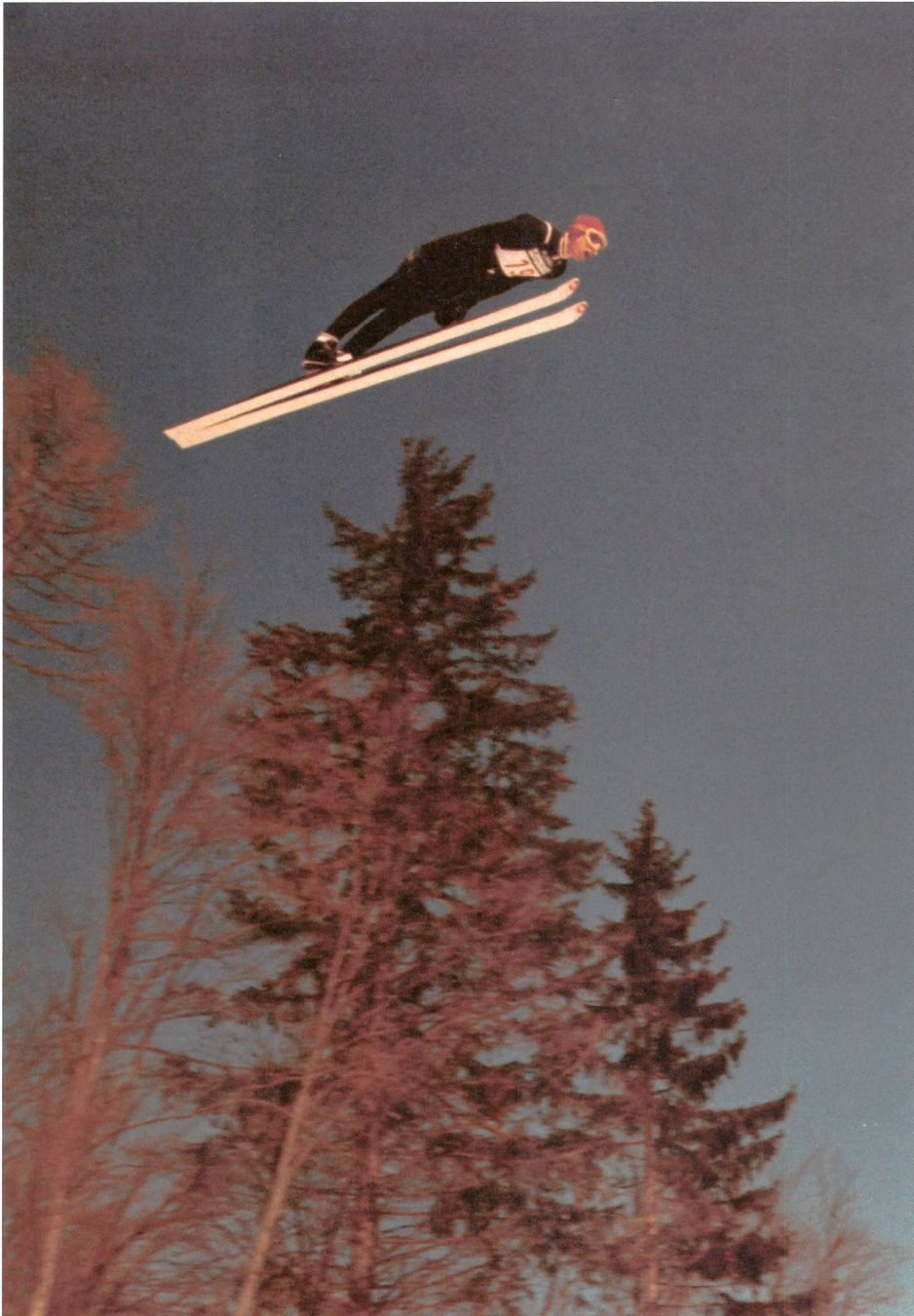
Walter Steiner wird Weltmeister; Planica 1974

heute. Damals war er enttäuscht: Die Szenen mit seinem Hauptanliegen fehlen, dafür weidet sich der Film noch und noch an Sequenzen von Stürzen, was die Kritik denn auch als «voyeuristische Mitleidlosigkeit» des Filmemachers auslegte.