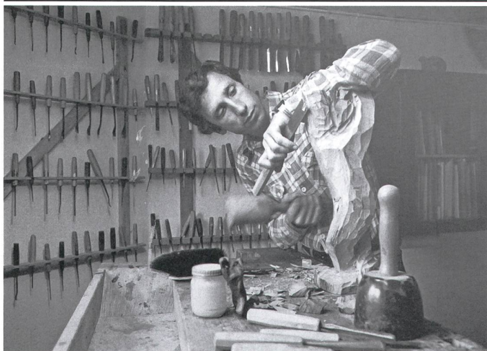
Walter Steiner in der Werkstatt in Wildhaus; um 1976

Heute sorgt sich der frühere Skispringer Walter Steiner um die Zukunft der Menschheit, seinerzeit regte er für die FIS-Norm eine verbesserte Sprungschanzenarchitektur an. «Ein Stück weit Pionier»: So heisst denn auch die Ausstellung über ihn im Wartsaal Lichtensteig.