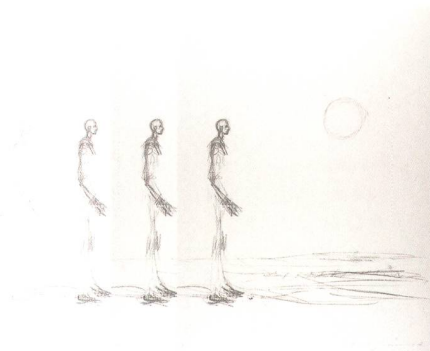
13.11. Die Kruz mit den Beweglichen Kulturförderung

Jeden Dienstag vom 13.11. bis 11.12.2018, im Café St.Gall in der Bibliothek Hauptpost, jeweils von 19.00 bis 20.00 Uhr, mit anschliessendem Apéro. Der Eintritt ist frei. Infos zu den Veranstaltungen unter www.kultur.sg.ch