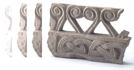
27.11. Die Wirren um die Fundstücke aus der Kathedrale Kantonsarchäologie