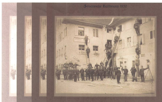
20.11. Alte Fotos: Restaurieren oder digitalisieren? Staatsarchiv