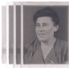
11.12. Salcia Landmann (1911–2002) Kantonsbibliothek