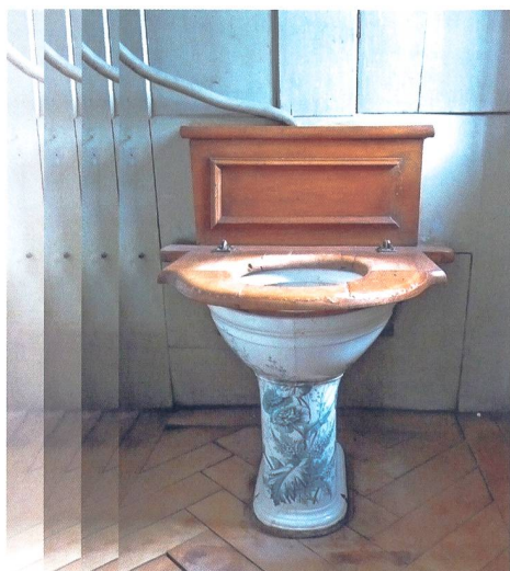
04.12. Auf dem Latrinenweg Denkmalpflege