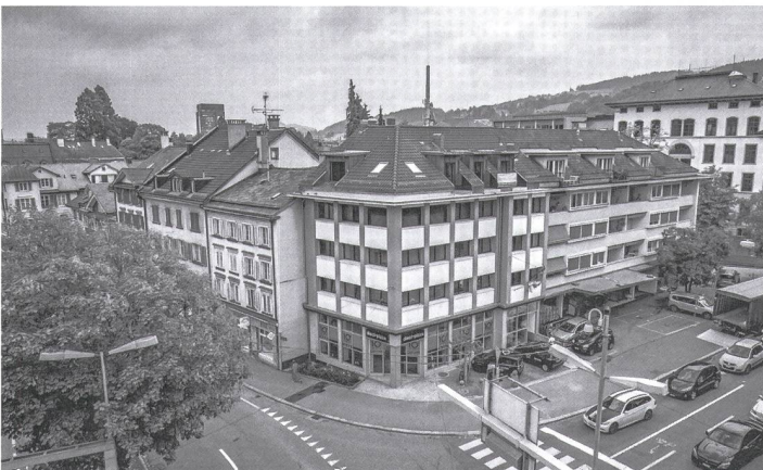
Der alte «Pfauen» 1925, Blick zum Platztor mit «Pfauen» und Avia-Tankstelle 1957, Situation heute.

Form der «veredelten» Wohngemeinschaft. Die Vorbilder stammen aus Zürich. Dort wurden die ersten Cluster 2010 bezogen. Genossenschaften hatten mit ihren Projekten «Mehr als Wohnen», «Kalkbreite», «Kraftwerk» und «Gesewo» (Genossenschaft für selbstverwaltetes Wohnen) diese neuen Grosswohnungen erstmals bauen lassen. Im Cluster verfügt jedes Zimmer über eine jeweils eigene Nasszelle mit Dusche und WC. Pro Wohnung gibt es aber – wie in einer WG – nur eine Gemeinschaftsküche und einen Aufenthaltsraum. Inzwischen wurden solche Wohnformen auch in anderen Städten realisiert – für St.Gallen sind sie nach Wissen des Bauherrn und des Architekten neu. Für den Ort, direkt gegenüber des künftigen Universitäts-Campus, seien sie prädestiniert. Pro Etage teilen sich hier fünf Bewohnerinnen oder Bewohner Küche und Aufenthaltsraum.