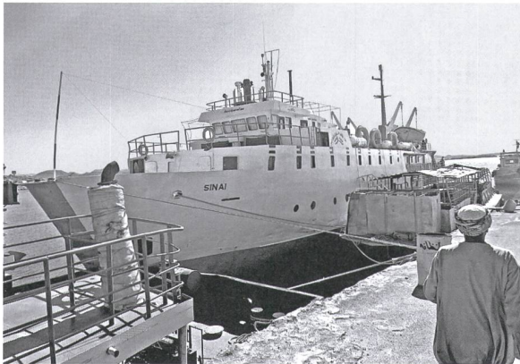
Die «Sinai» verkehrt regelmässig zwischen Assuan High Dam und Wadi Halfa.