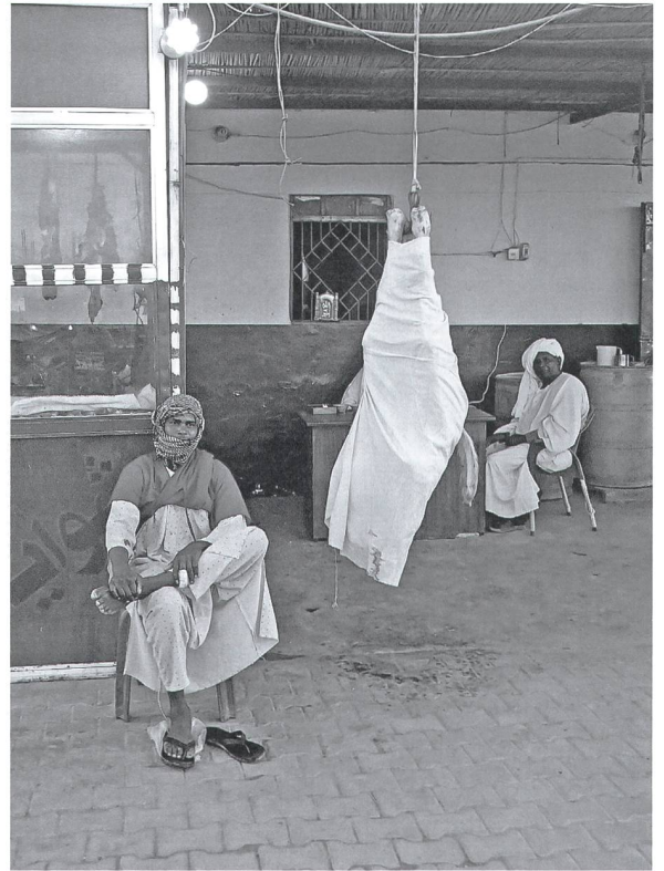
Der Metzger schneidet immer grad soviel Fleisch vom Kamel, wie der Kunde braucht.

Der Anruf von der Bank kam schon am nächsten Tag: «Ist Ihre Überweisung an die sudanesisische Botschaft in Genf privater oder geschäftlicher Natur?» Leer schlucken, dann überlegen: Ist eine Recherchereise privat oder geschäftlich? Der Bänkler übernimmt das Denken: «Ich sehe, dass sie diese 95 US$ wohl für ein Visum überweisen wollen, und wir möchten gerne wissen, ob ihre Reise in den Sudan eine Ferienreise ist oder eine Geschäftsreise. Wissen Sie, Geschäfte mit dem Sudan sind wegen Sanktionen der USA gegen den Sudan verboten. Wir müssen uns dem anschliessen.» Hoppla, die geplante Reise von Alexandria nach Khartoum scheint höchst politisch zu werden, denkt sich der abreisebereite Geldüberweiser.