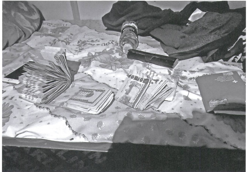
Stets viel Papiergeld im Hosensack: sudanesische Pfund, US-Dollar, ägyptische Pfund (von links).

Die Hotelschiffe aus Assuan (bzw. Assuan High Dam), die drei Tage oder eine Woche auf dem zwischen 1964 und 1976 gebauten Stausee kreuzen und bleiche Touristen zum Weltkulturerbe Abu Simbel fahren, kommen nicht nach Wadi Halfa. Wadi Halfa ist ein Kaff, in dem es nichts zu sehen und ausserdem keinen Alkohol gibt. In ganz Sudan gibt es keinen Alkohol, streng muslimisch ist das Land, weniger streng wird das in Ägypten gehandhabt. Hier in Wadi Halfa, im einstigen Nubien, wird man ohne Umschweife von der Strasse weg zum Mittagessen eingeladen; drüben in Assuan muss man aufpassen, nicht von gierigen Geldwechslern und selbsternannten Touristenführern abgezockt zu werden. In Wadi Halfa kommt es keinem Kind in den Sinn, die hohle Hand zu machen, drüben in Ägypten werden die Kids dazu erzogen. Wo Touristen sind, herrscht der Nepp, und jetzt, wo der Tourismus in Ägypten wegen der Terroranschläge zusammengebrochen ist, kümmert man sich doppelt aufdringlich um die Wenigen, die noch kommen.