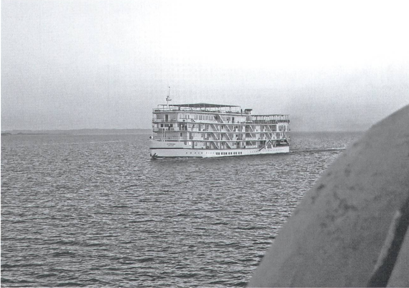
Das Mövenpick-Hotelschiff auf dem Nassersee ist zurzeit schlecht gebucht.