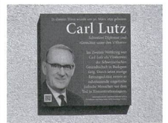
Gedenktafel für Carl Lutz

Die hiesige Ausschaffungspolitik ist kein Thema. Und die Situation auf dem Mittelmeer und an den EU-Aussengrenzen muss die Schweiz dank Schengen-Dublin herzlich wenig kümmern. Man hilft am liebsten «vor Ort», also in den «Herkunftsändern», wohin man die Menschen gerne zurückschickt – jetzt auch wieder vermehrt nach Afghanistan und Somalia. Im Bundesbehördendeutsch der Direktion für Entwicklung und Zusammenarbeit klingt das dann so: «Wir wollen innerhalb eines vertretbaren Kostenrahmens die effektivste Wirkung erzielen und so viele Bedürftige wie möglich erreichen.» Was darfs denn kosten? (hrt)