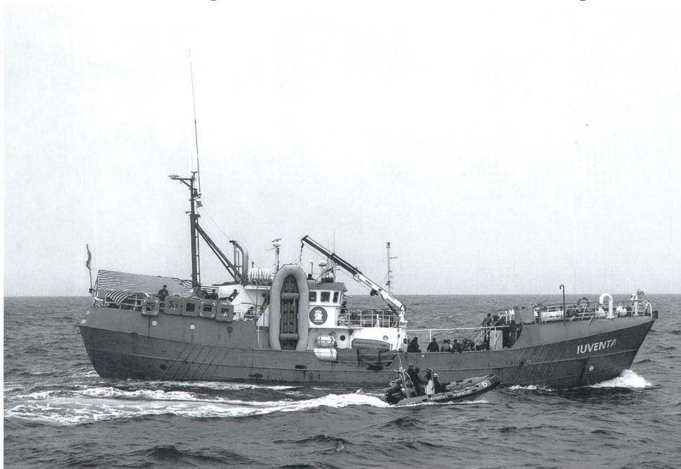
Das Rettungsschiff Iuventa im Mittelmeer.

«Wenn Menschen in Not sind, ist nicht die Hilfe kriminell, sondern die Passivität.» Das schreibt die Paul Grüninger Stiftung und zeichnet mit ihrem Hauptpreis die Crew des Rettungsschiffs Iuventa aus. Preisverleihung ist im Mai in St.Gallen.