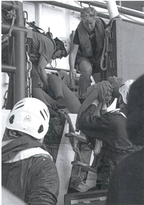
Rettung auf der Iuventa.

fragen, während ihr Leben in unmittelbarer Gefahr ist. Es war und bleibt unser aller Verantwortung, Menschenleben zu retten, wann immer es möglich ist, Schutz zu bieten, wo er benötigt wird, und jedem Menschen mit Würde und unter Berücksichtigung der universell geltenden Menschenrechte zu begegnen. Die Rettung von Menschen auf See ist eine Pflicht, nicht bloss ein Recht, und gewiss kein Verbrechen.