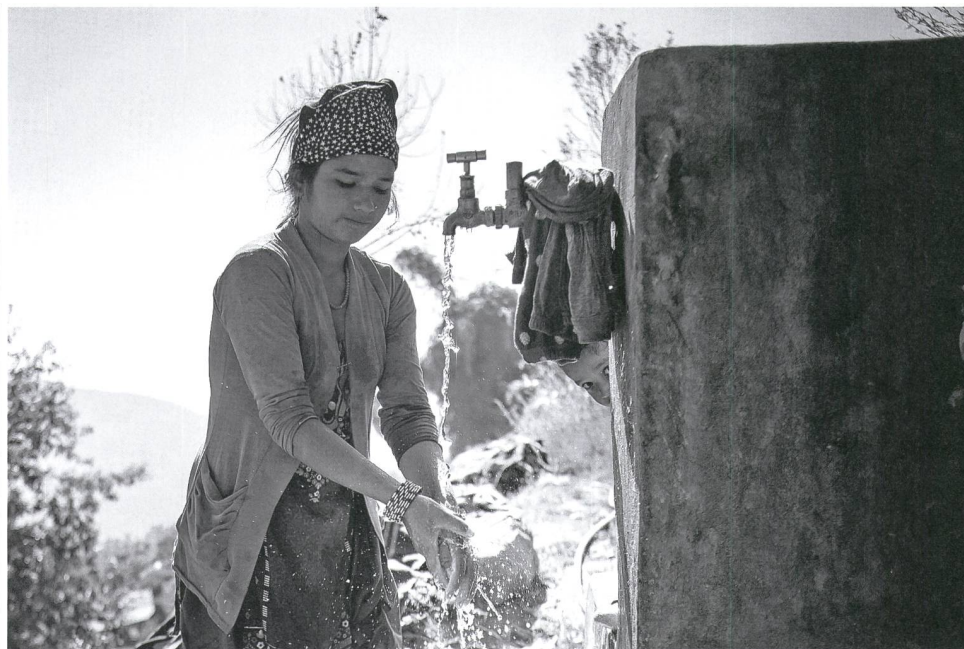
Sauberes Trinkwasser: Dafür setzt sich Viva Con Agua ein.

«Wasser für alle – alle für Wasser» lautet das Motto von Viva Con Agua. Die Nonprofit-Organisation setzt sich für sauberes Trinkwasser weltweit ein. Dabei nutzt sie Kultur als Brückenbauerin und die Wirtschaft als Mittel zum Zweck – so im Mai beim Goba-Festival in Gontenbad. Text: Andri Bösch