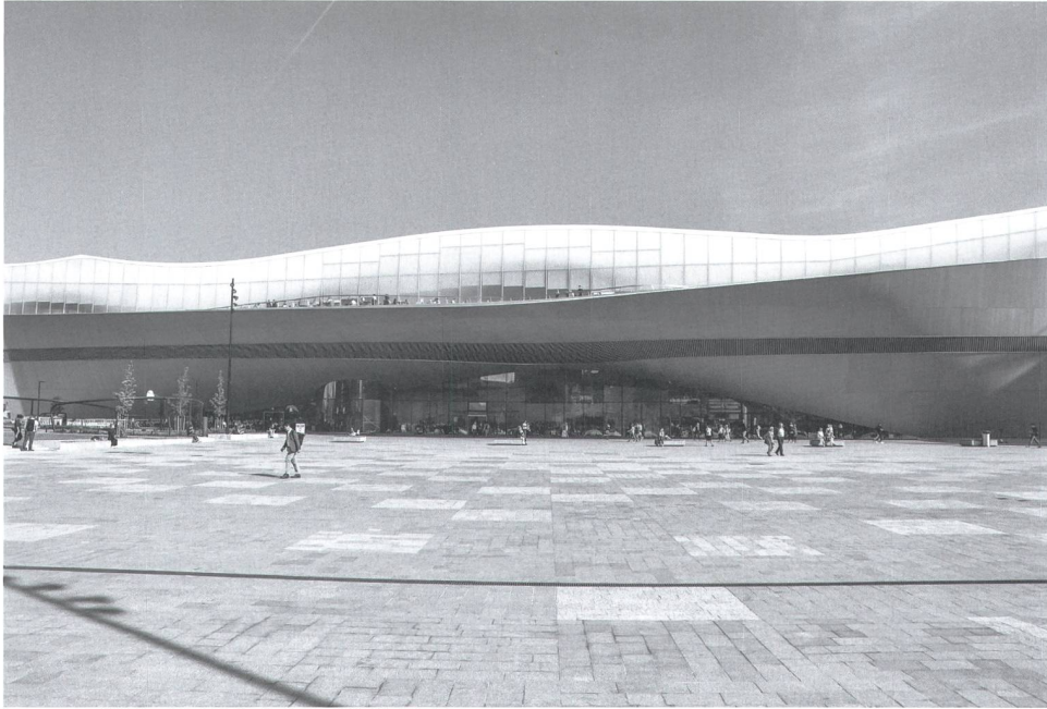
Imposante Welle: Die Bibliothek Oodi in Helsinki.