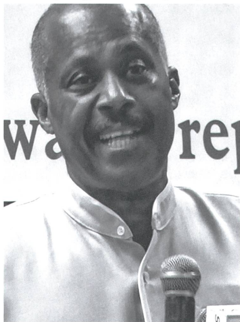
Der Präsident der CARICOM Reparations Commission, der Historiker Sir Hilary Beckles eröffnet das Symposium.

2013 hat die CARICOM, die Gemeinschaft von 14 Staaten der Karibik, eine Initiative für die Wiedergutmachung der Sklaverei lanciert, unter der die Region während Jahrhunderten – und auch noch über die Emanzipation hinaus – gelitten hat. Unter dem Vorsitz des renommierten Historikers Sir Hilary Beckles aus Barbados, Vizekanzler der University of the West Indies in Mona (Jamaika), entstand die CARICOM Reparations Commission (CRC), und die Regierungen der