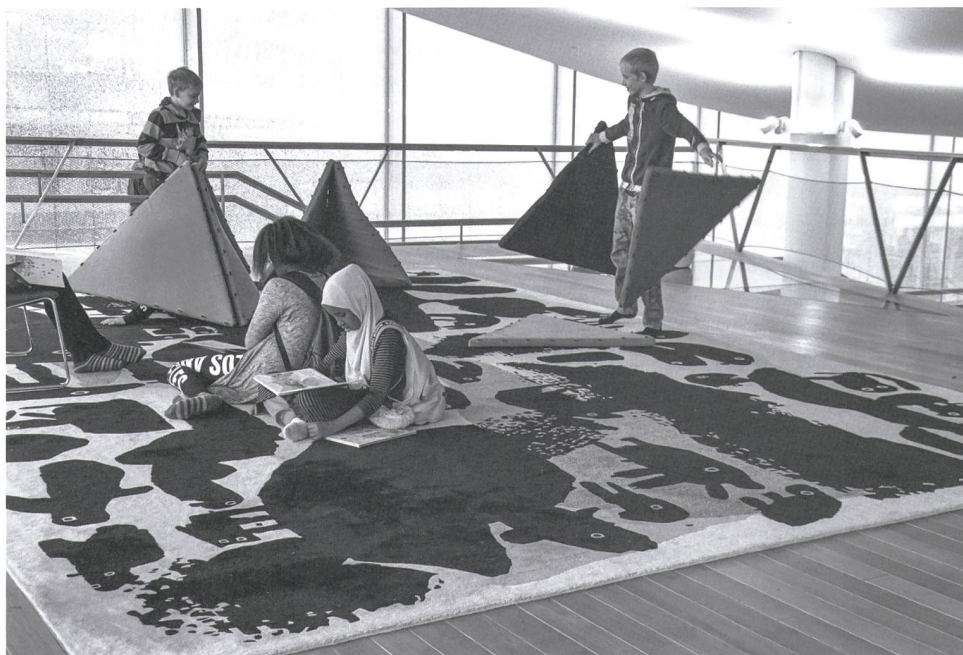
Lesen auf dem Kunst-Teppich in der Bibliothek.

entfernt, das der amerikanische Architekt Steven Holl 1992 baute. Auf dem Areal des «Lasipalatsi» (Glaspalast), einem Ensemble funktionaler Flachbauten mit dem Kino Rex, das 1936 als temporärer Bau für die Olympischen Spiele errichtet worden war, konnte 2018 das neue Museum eröffnet werden. Der schwedischsprachige finnische Zeitungsverleger und Kunstliebhaber Amos Anderson (1878–1961) sowie sein Erbe finanzierten das private Museum «Amos Rex» mit. Im ersten Jahr zählte man über 500'000 Besucherinnen und Besucher, sagt Sprecherin Lia Palovaara.