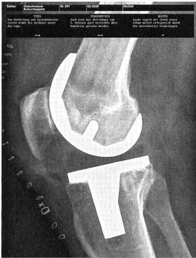
Nr. 297, Februar 2020