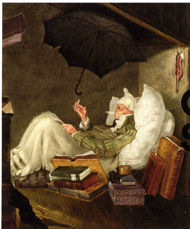
Carl Spitzweg, Der arme Poet (Detail), 1838, Privatbesitz