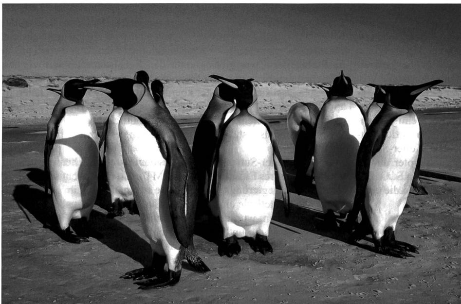
Ob sich die Königspinguine über den Besuch freuen?