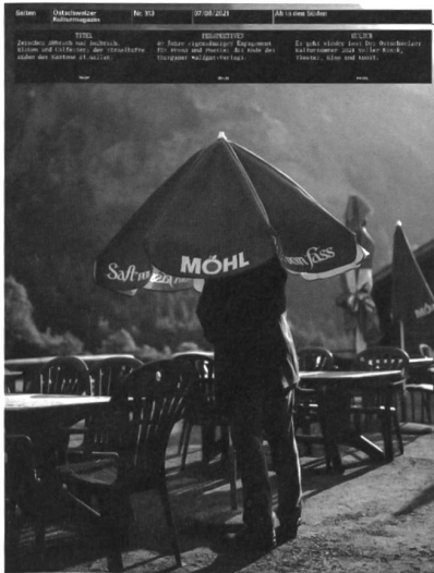
Nr. 313, Juli/August 2021

Zum Artikel saiten.ch/vier-guellener-graffiti