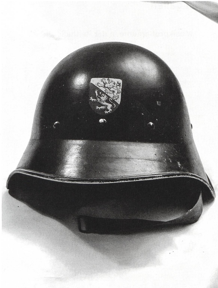
Feuerwehrhelm aus dem Kanton Thurgau, 20. Jahrhundert