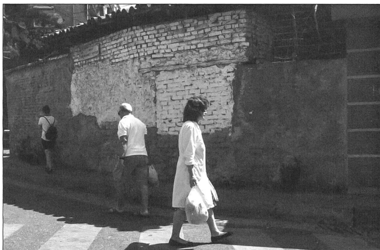
Hinter den glitzernden Fassaden und den grossen Boulevards wirkt Tirana fast dörflich: Man kennt sich beim Gemüse-Einkauf und grüsst die Nachbar:innen.

Tirana ist eine Stadt im Umbruch, um es simpel zu sagen. Vor 30 Jahren