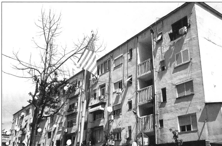
Dem amerikanischen Traum wird nicht mehr ganz so unrealistisch begegnet, aber die USA stehen immer noch für geopolitischen Schutz und persönliche Hoffnung.

Heute hat Tirana ein mediterranes Flair, es fühlt sich für Neuankömmlinge an wie eine Mischung aus Neapel, Istanbul und Athen, auch wenn es rund 30 Autominuten vom Meer entfernt liegt. In Bars hört man griechische Musik. In Supermärkten gibt es italienische Waren; mit der einstigen Besatzungsmacht pflegt man heute Wirtschaftsbeziehungen. Den USA gegenüber ist man dankbar, für die Hoffnung damals und die schützende Hand heute, weswegen man Bäckereien findet namens George W. Bush und Plätze, die nach Woodrow Wilson benannt sind. Die Strasse, in der die russische Botschaft steht, wurde kurzerhand nach Kriegsausbruch in