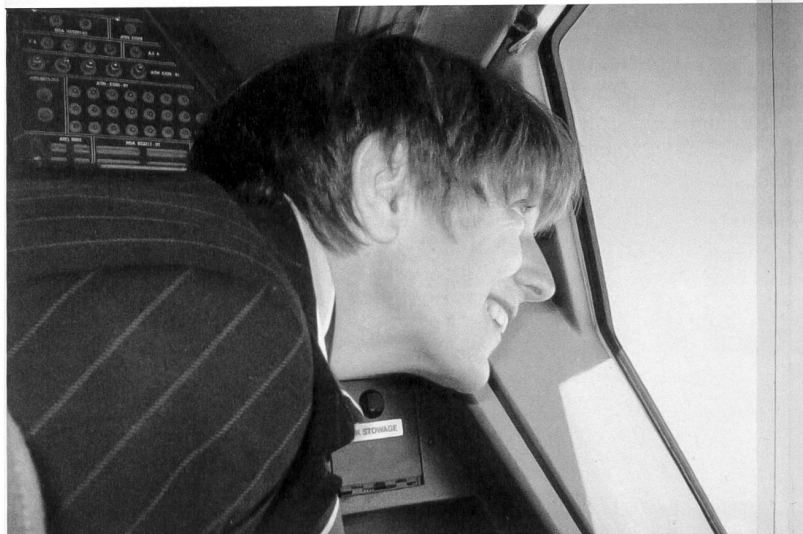
Bildlegende: Blick aus dem Cockpitfenster auf den Kilimandscharo.