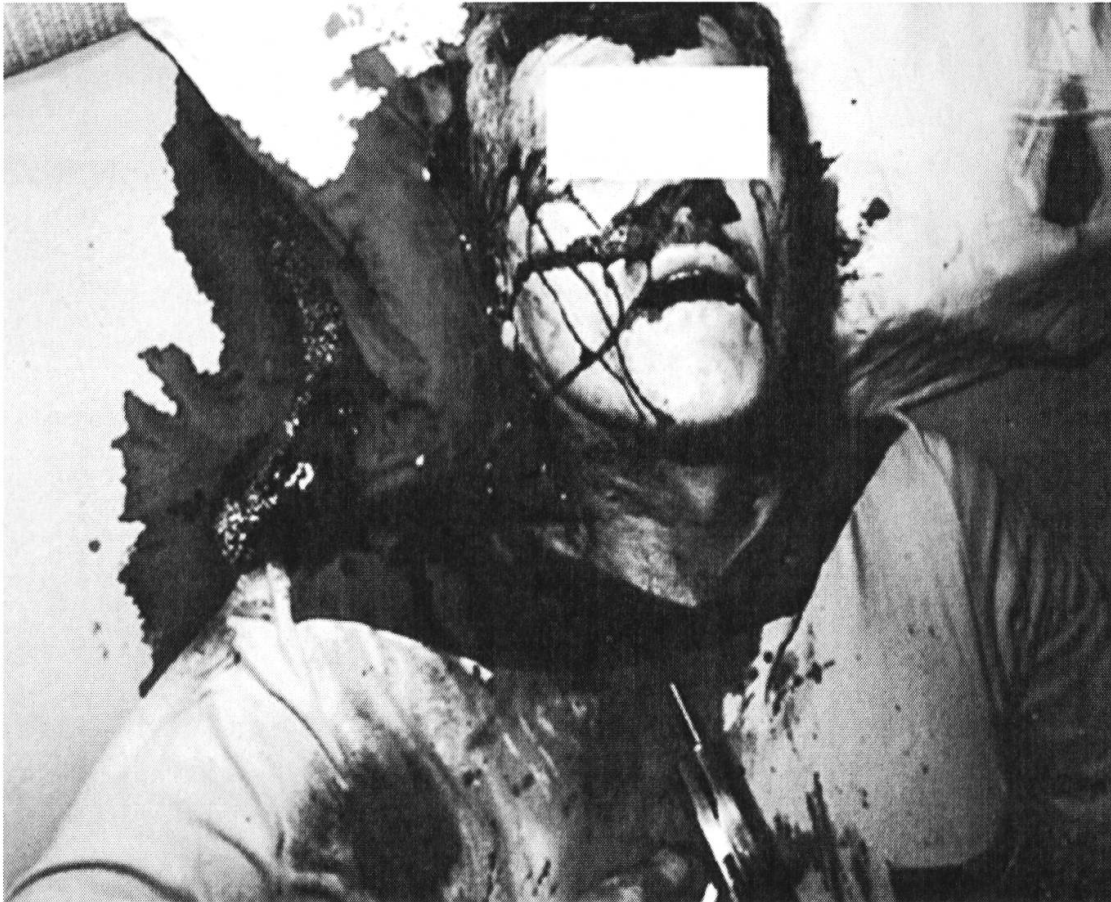
Bild 4: Horizontal und vertikal verlaufende Abrinnsuren des Blutes.

Bei der Betrachtung der Leiche fallen die unterschiedlichen Verlaufsrichtungen der Blutabrinnsuren auf. Der Gravitation zufolge muss die Leiche demnach bewegt worden sein. Also eher ein Tötungsdelikt?