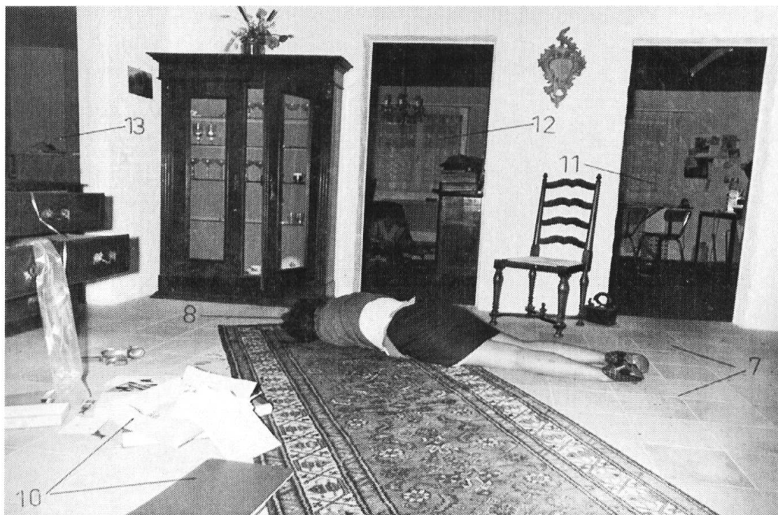
Bild 1: Übersicht des Leichenfundortes mit den geöffneten Schubladen und den herausgerissenen Gegenständen.

Nach Angaben von Herrn K. in der ersten Befragung fehlten 2 Sparhefte und ein Geldbetrag von ca. CHF 2'000.—.