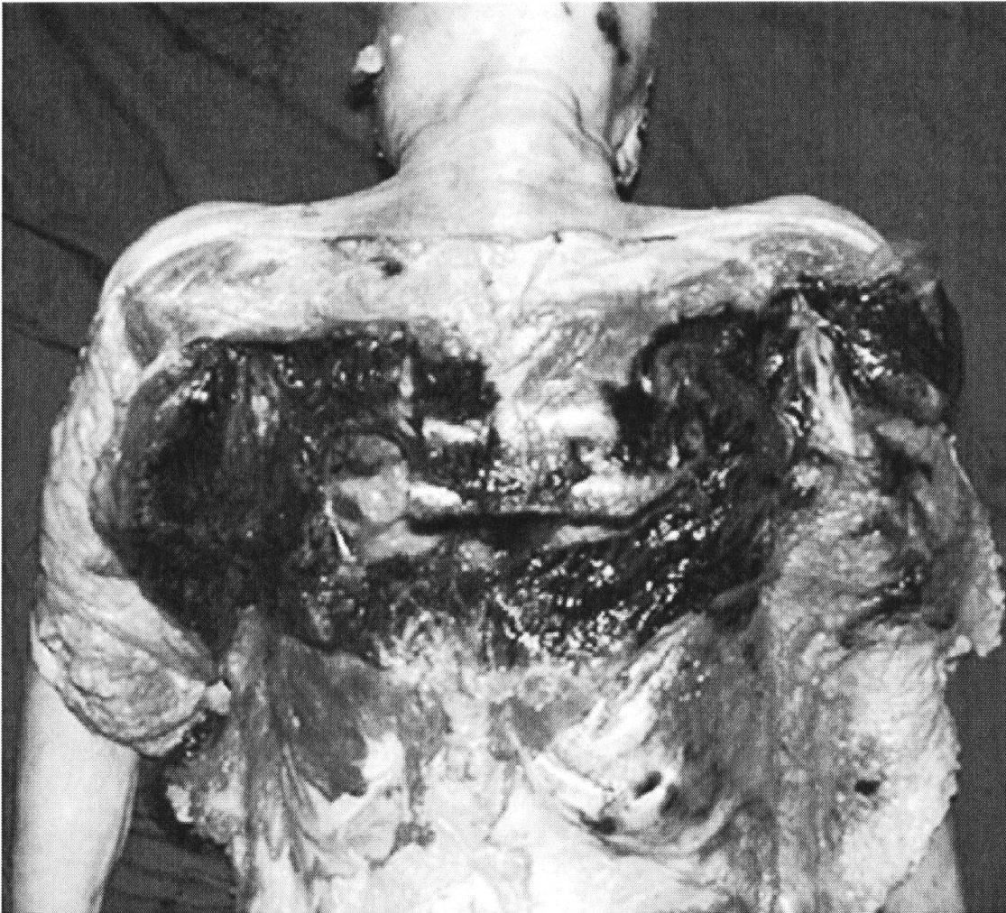
Bild 3: Oberkörper der Leiche mit massivsten Blutungen und Brüchen. Der Täter machte einen Treppensturz des Opfers geltend. Das rechtsmedizinische Gutachten hält demgegenüber fest, dass die Schwere und Intensität der Verletzungen einem Flugzeugabsturzopfer entsprechen und schliesst einen Treppensturz als Ursache aus.