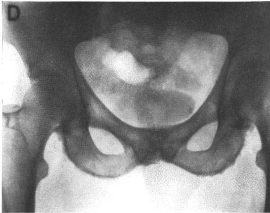
Fig. 2. Cas P. G. Arthrose coxofémorale droite. Aspect hérissé des zones d'insertion musculotendineuses. Sclérose et ostéophytose de la symphyse avec projection concomitante de calculs prostatiques.

altération osseuse ne peuvent être mis en évidence dans les années qui suivent. Les examens d'urine de 31 proches parents sont tous négatifs.