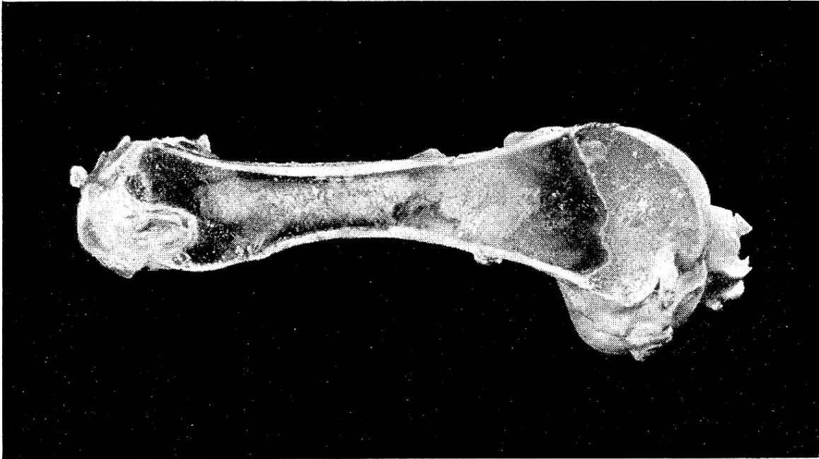
Abb. 2. Femur des gleichen Rindes, wie Abb. 1, hochgradige Osteoporose.