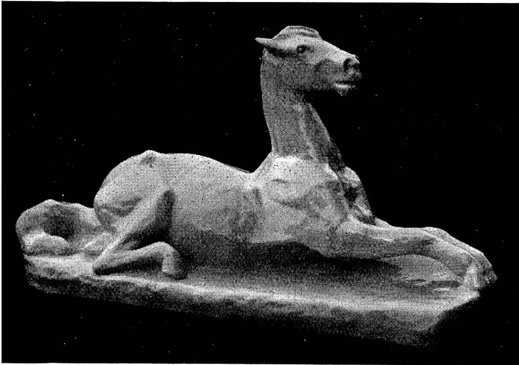
Orig. 43: 24 cm