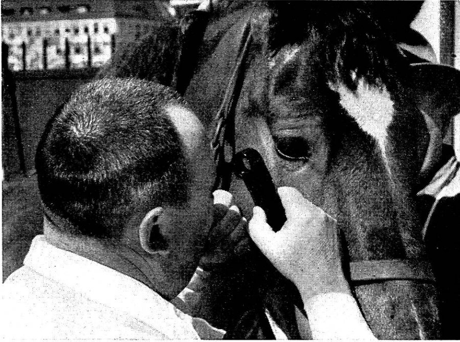
Abb. 1. Die Leuchtlupe zur Besichtigung der vordern Augenabschnitte.