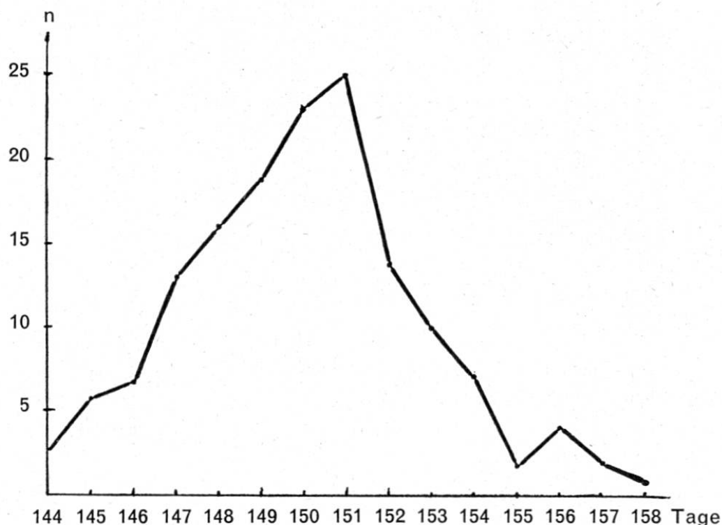
Fig. 3. Trächtigkeitsdauer der Kreuzungsprodukte.

breite der Tragzeit betrug 144–158 Tage (s. Fig. 3). Diese Befunde stimmen mit jenen von Richter (1931), Asdell und Hinterthür (1933) gut überein.