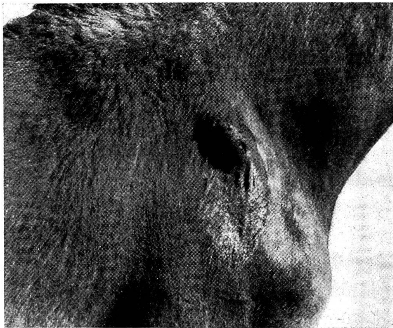
Abb. 1. St. 143/45, Schulterbursitis rechts nach Inzision und scharfer Friktion.

St. 12/45 , Wallach, Fuchs, 2 Jahre. Auf der rechten Schulter saß vor der Spina scapulae eine pralle, unschmerzhaft, fast faustgroße Anschwellung. Die Operation ergab eine derbe Kapsel von \frac{1}{2} —1 cm Dicke mit glatter Auskleidung und fibrös-fibrinösen Auflagerungen. Histologische Untersuchung 1 : Derbe Bindegewebskapsel, Bindegewebsverquellung. Hyperämie, Blutungen, Blutpigment. Innenauskleidung