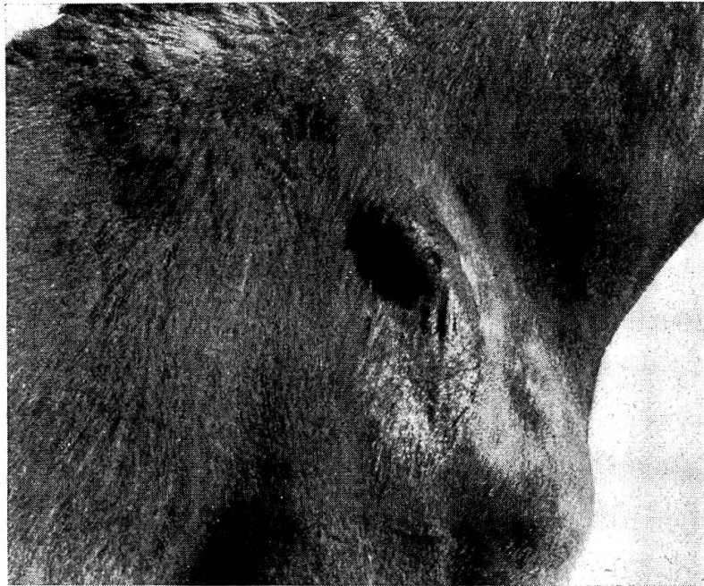
Abb. 1. St. 143/45, Schulterbursitis rechts nach Inzision und scharfer Friktion.

St. 12/45 , Wallach, Fuchs, 2 Jahre. Auf der rechten Schulter saß vor der Spina scapulae eine pralle, unschmerzhaft, fast faustgroße Anschwellung. Die Operation ergab eine derbe Kapsel von \frac{1}{2} —1 cm Dicke mit glatter Auskleidung und fibrös-fibrinösen Auflagerungen. Histologische Untersuchung 1 : Derbe Bindegewebskapsel, Bindegewebsverquellung. Hyperämie, Blutungen, Blutpigment. Innenauskleidung