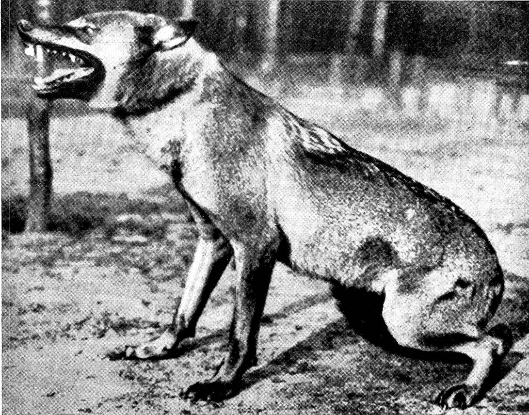
Abb. 1. In die Enge getriebener Wolf . Das Tier würde fliehen, wenn es die Möglichkeit dazu hätte. Die Angst kommt in der verkrampften, hinten geduckten Körperhaltung und der eingeklemmten Rute gut zum Ausdruck. Vorne zeigt es die Drohgebärde, und es würde bei weiterer Annäherung, nicht aus Angriffslust, sondern aus Angst, zur „verzweifelter“ Selbstverteidigung übergehen. Das gleiche Verhalten zeigen auch ausgesprochen scheue Hunde (sog. Angstbeißer).

„Verzweiflung“; ein psychischer Zustand, der schon manchem Wildfang das Genick oder das Herz gebrochen hat. Die Gewöhnung an den Menschen braucht beim einen Tier längere, beim anderen kürzere Zeit. Immer ist dies aber eine kritische Periode, die das Tier in eine eigentliche seelische Notlage versetzt, von Seiten der Pfleger viel Verständnis für die besondere Situation