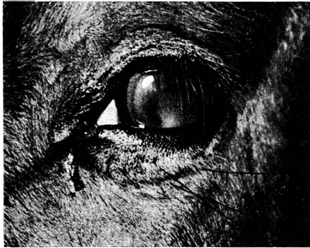
Abb. 2. Experimentelle, 7 Monate nach extra-okulärer Leptospira-pomona -Infektion entstandene, 10 Tage alte Iridocyclitis acuta . Versuchsfohlen Nr. VI. Agglutinationstiter: Blut 1:2000, Augenkammerpunktat 1:10 000.

4. Von den 6 zur Verfügung gestandenen Fohlen, deren Serum sich ohne Agglutinationsreaktion für Leptospira erwies, erkrankten nach extraoku-