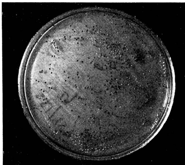
Milieu «W». Culture pure de Brucella abortus . Inhibition des germes secondaires.

L'utilisation de milieux de cultures, au contraire, permet de déceler des infections même très faibles du lait. La recherche du bacille de Bang, au moyen de milieux de cultures, exige des prélèvements aseptiques. Elle est limitée souvent par le grand nombre, spécialement durant la saison chaude, de germes de toutes sortes qui peuvent pulluler dans le lait. La présence de moisissures notamment entrave beaucoup cette recherche.