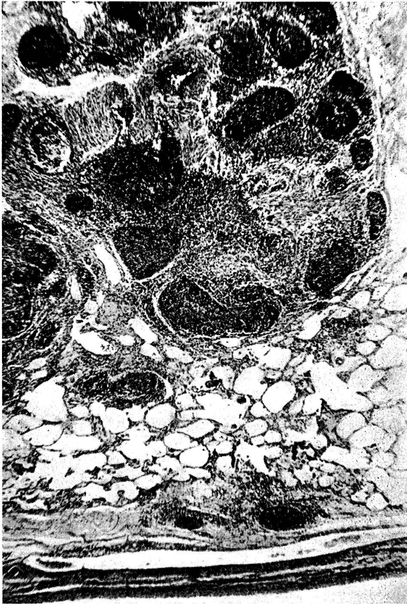
Fig. 3. Chronische Lungenwurm-pneumonie mit begrenzten Anhäufungen von lymphoidem Gewebe und Hyperplasie der glatten Muskulatur der Bronchiolen.

Die Kultur und damit der endgültige Beweis seiner ätiologischen Rolle ist nicht gelungen. Aber vieles spricht dafür. Wahrscheinlich handelt es sich um einen Organismus, ähnlich dem Erreger der Lungenseuche des Rindes.