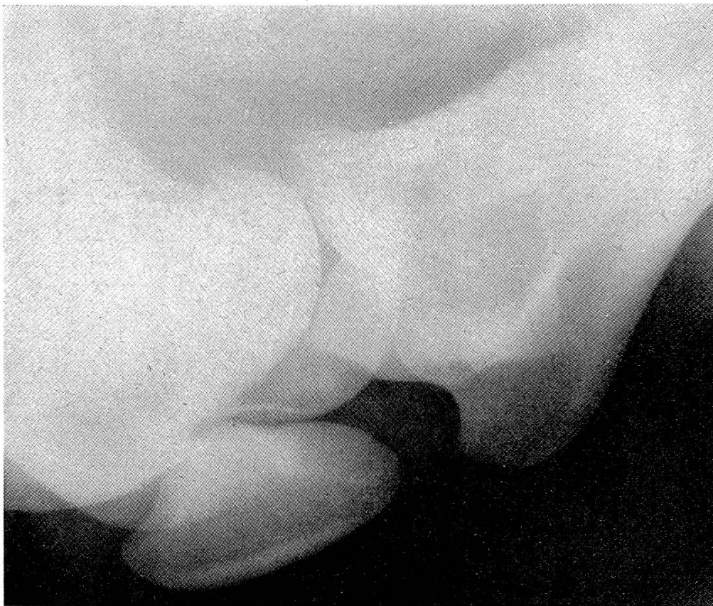
Links: Das Kniegelenk mit der Luxatio patellae inferior. Rechts: Eine Vergleichsaufnahme mit ungefähr gleichem Gelenkwinkel. Man beachte die unterschiedliche Lage der Patella.