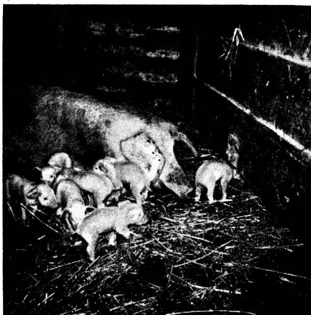
2. Wurf, 3 Tage alt.

Über die Superfötation beim Schwein bestehen in der Literatur verschiedene Mitteilungen. So berichtet Eliason ( Journ. of American Vet. Med. Ass. , Nr. 856, S. 41, 1948), daß eine Sau 3 ausgewachsene Ferkel warf und 3 Wochen später nochmals 5 ausgewachsene lebensfähige Tierchen. Nach Grabherr ( Wien. Tierärztl. Monatsschr. , S. 285, 1948) gebar eine Erstlings-sau 14 lebende Ferkel, nach einer Trächtigkeitsdauer von 16 Wochen und drei Tagen. 5 Wochen nach der ersten Geburt brachte dieselbe Sau nochmals 8 normale Ferkel zur Welt, welche aber alle innerhalb von 48 Stunden eingingen. Eine weitere Mitteilung stammt von Klaas ( Deutsche Tierärztl. Wochenschr. , S. 255, 1950). Danach warf eine 1½-jährige Sau nach einer Trächtigkeitsdauer von 15 Wochen 4 etwas schwache Ferkel. 68 Tage später gebar sie nochmals 14 gutentwickelte, lebensfähige Junge.