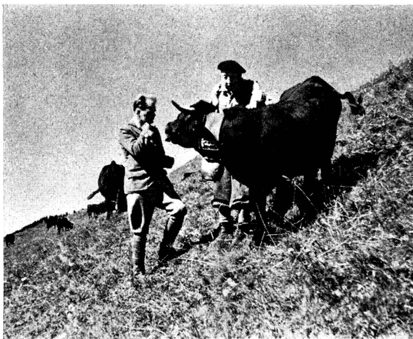
Deux savants au travail

Dans le cadre de ce mémoire, il ne nous est pas possible de rappeler tous les faits qui marquent cette période et qui pourraient caractériser le comportement du vétérinaire. Nous dirons seulement que le travail des tuberculinations, contrôles, examens cliniques, impose aux praticiens non seulement un surcroît de travail mais surtout une discipline stricte et parfois harrassante. L'un ou l'autre ont de la peine à s'y adapter et au lieu de mettre la main à la pâte ils trouvent plus confortable de remplir les fonctions de juges et de critiques.