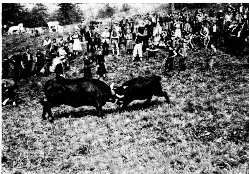
Vaches indemnes de tuberculose, véritables phénomènes qui supportent également le vent qui souffle du glacier et la chaleur torride de la plaine.

Pendant longtemps, non seulement la tuberculose bovine a causé les plus lourdes pertes à nos agriculteurs, mais elle a menacé directement et dangereusement la santé de nos populations et surtout de nos enfants. Or, malgré les progrès de la médecine, la tuberculose humaine reste encore à l'heure actuelle une maladie redoutable qui choisit ses victimes quelquefois brutalement, la plupart du temps sournoisement et dans toutes les classes de la société. Et, qui peut évaluer la somme des souffrances physiques et morales qu'elle entraîne non seulement pour le malade, mais pour son entourage? Le lien entre la tuberculose bovine et la tuberculose humaine est devenu trop évident pour qu'on puisse essayer de lutter contre l'une sans combattre l'autre. C'est pourquoi, au triple point de vue humanitaire, social et économique, l'élimination de ce fléau, la tuberculose bovine, est une magnifique victoire. Même si elle a coûté cher à remporter, le résultat en vaut la peine et constitue en fin de compte un bénéfice qui ne peut s'apprécier seulement à prix d'argent.