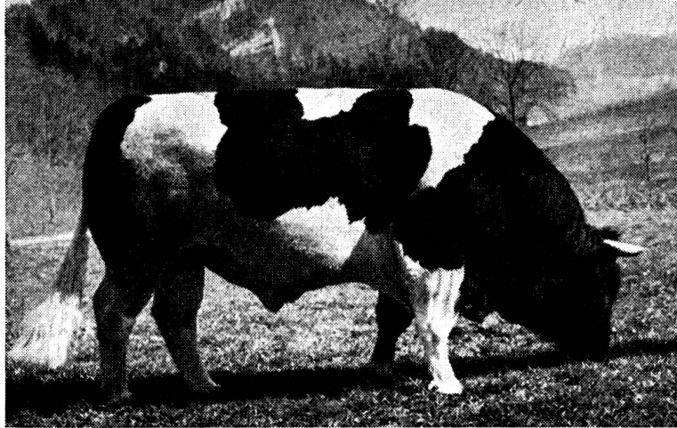
Zuchtstier Ardent 460 Grangeneuve

Das Hauptverbreitungsgebiet liegt im Kanton Freiburg, so vor allem in der Gruyère, wie im Neuenburger, Berner und Basler Jura. Vereinzelt Zuchten treffen wir im ganzen Flachland zwischen Bern und Schaffhausen.