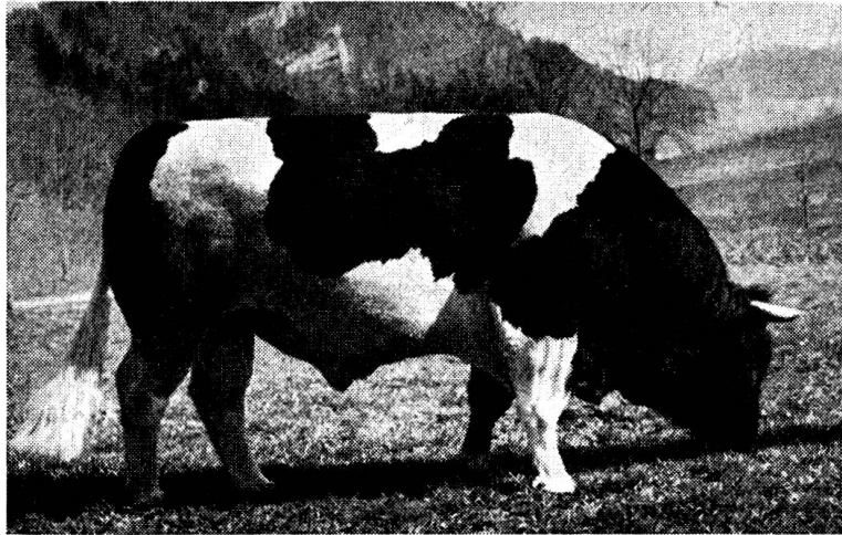
Zuchtstier Ardent 460 Grangeneuve

Das Hauptverbreitungsgebiet liegt im Kanton Freiburg, so vor allem in der Gruyère, wie im Neuenburger, Berner und Basler Jura. Vereinzelt Zuchten treffen wir im ganzen Flachland zwischen Bern und Schaffhausen.