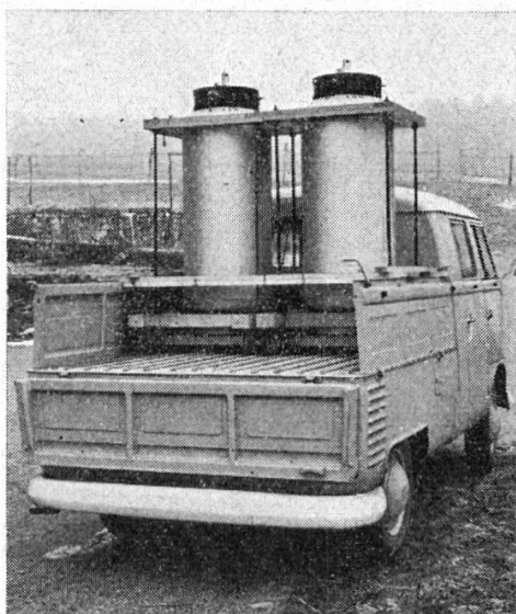
Abb. 3 Lieferwagen mit zwei Druckbehältern zu 110 l bzw. 160 l für die Versorgung der Außenstellen mit flüssigem Stickstoff.

Die Empfindlichkeit und der hohe Preis der Tk-Behälter erlaubt die Benützung der öffentlichen Transportmittel nur in Ausnahmefällen. Die Besamungsstation wird deshalb mit eigenen Fahrzeugen in einem regelmäßigen, voraussichtlich 14tägigen Turnus den fl.N und den Tk-Samen auf bestimmte, vom Wohnort des Besamers möglichst nicht zu weit gelegene Sammelplätze bringen (Abb. 3).