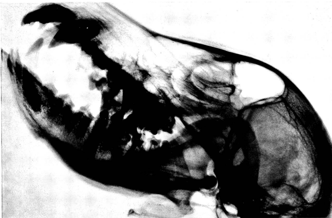
Abb. 1 Axiale Schädelaufnahme vom 22. April 1963