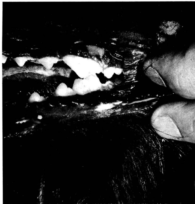
Abb. 4 Mesialbiß