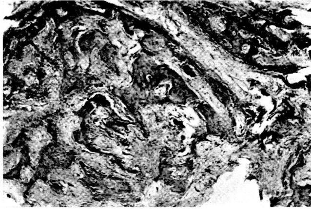
Abb. 2 Histolog. Schnitt aus der Probeexzision. Vergrößerung 35fach. Hämalaun-Eosin-Färbung