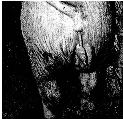
Eber Mißbildung in Harn- und Geschlechtsanlage: äußerlich 1 Hoden und daneben Penis mit Harnröhrenöffnung. Zweiter Hoden kryptogen in Bauchhöhle, Operation Mai 1967.

Zur Schweinepraxis gehören auch Kastrationen, die noch kurz behandelt werden sollen. Betreffs « Ferkelkastrationen » befinden wir uns ja in gewisser Konkurrenz, die je nach Gegenden mehr oder weniger groß ist. Es betrifft dies die sogenannten Laienkastrierer, die für mich jedoch nie Grund zur Aufregung waren. Hin und wieder haben auch Besitzer selbst die Operation vorgenommen.