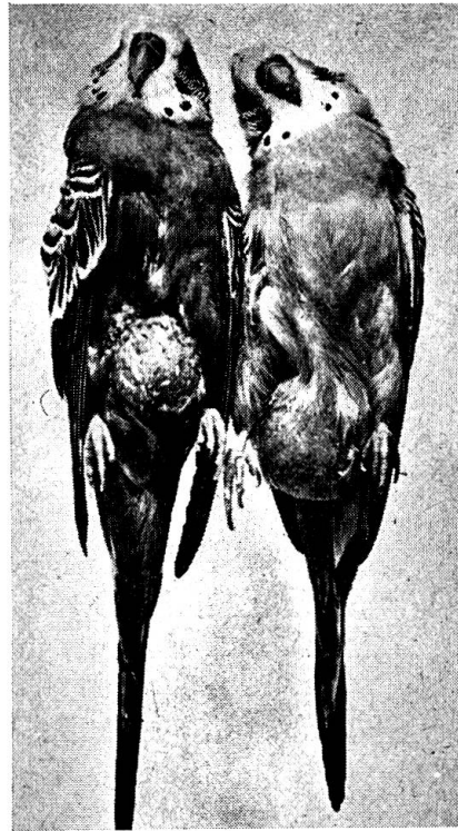
Abb. 1 Kropfentzündung mit Erbrechen schleimigen Kropfinhaltes