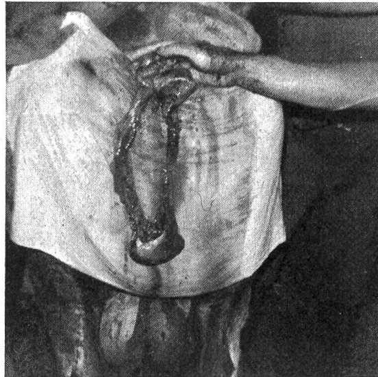
Fig. 1 On devine les perforations à mi-hauteur, à gauche et à droite. Quelques anses ont été extraites de l'abdomen. L'écrasement n'est pas encore visible.