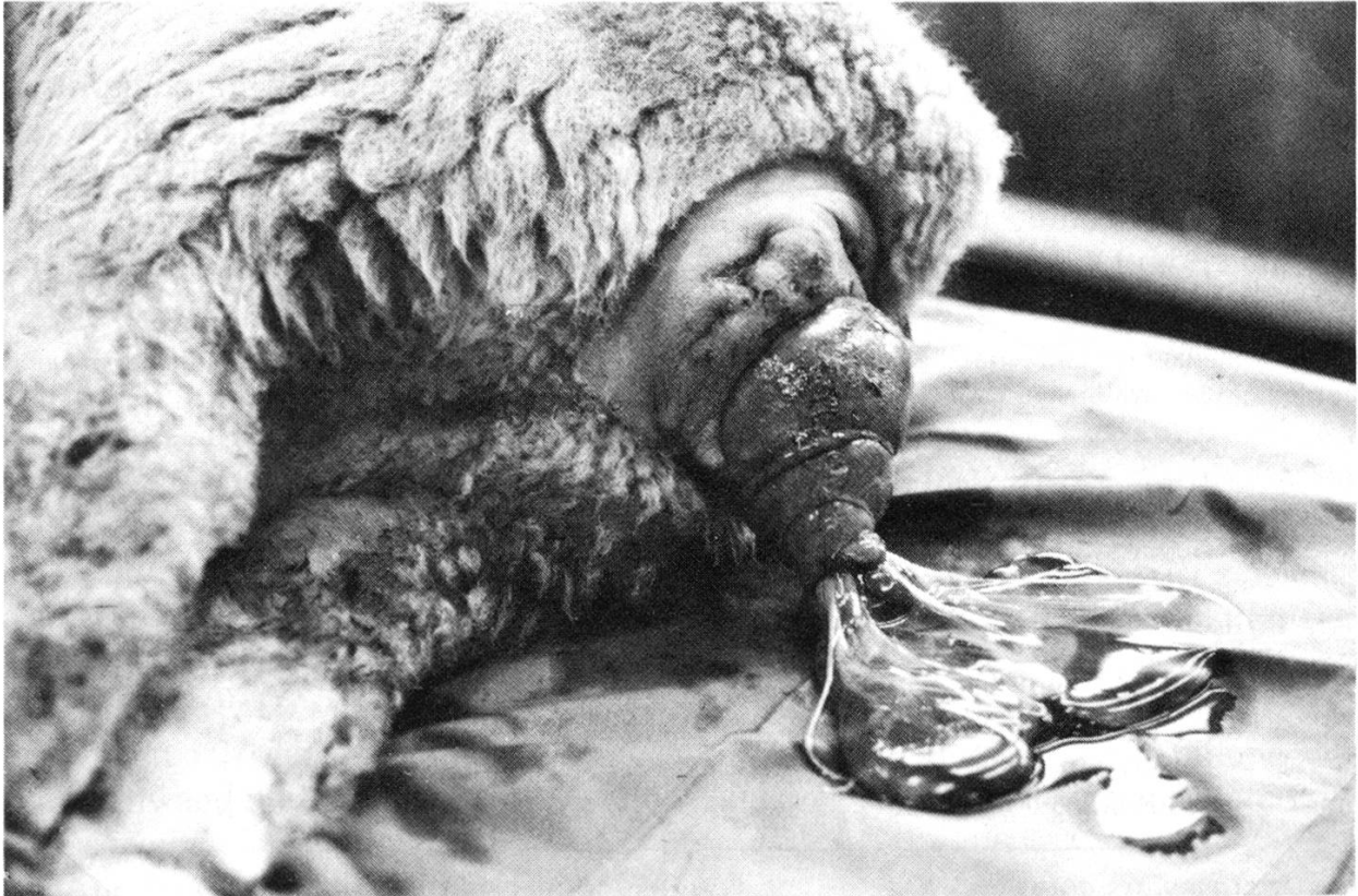
Abb. 3 Tropfenartiger Fruchtblasenvorfall durch eine minimal eröffnete Zervix bei einem Schaf mit Scheidenvorfall.

Vereinzelt traten neben dem Scheidenvorfall weitere Komplikationen auf, die mehr oder weniger im Zusammenhang mit dem Vorfall standen, allerdings ohne den Geburtsverlauf zu stören. So beobachteten wir bei vier Schafen Harnstauungen, bei drei Tieren zugleich einen Mastdarmvorfall, zwei Tiere wiesen massive Scheidenrupturen auf, und in drei Fällen trat post partum ein Prolapsus uteri auf. 24 Schafe zeigten in irgendeiner Form Erkrankungen an den Klauen.