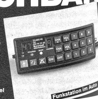
Funkstation im Auto

Stöcklen 17, CH-6343 Rotkreuz/Meierskappel Postfach 96, Telefon 042/64 24 53