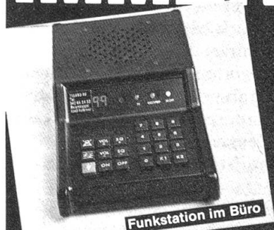
Funkstation im Büro