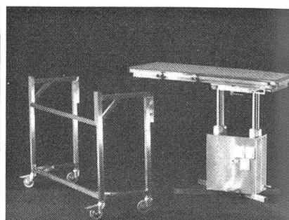
OP-Tisch-System: Oberteil transportabel, mit oder ohne Wagen

Graf von Schlieffen D-4901 Hiddenhausen Tel. 0049-5221-61838