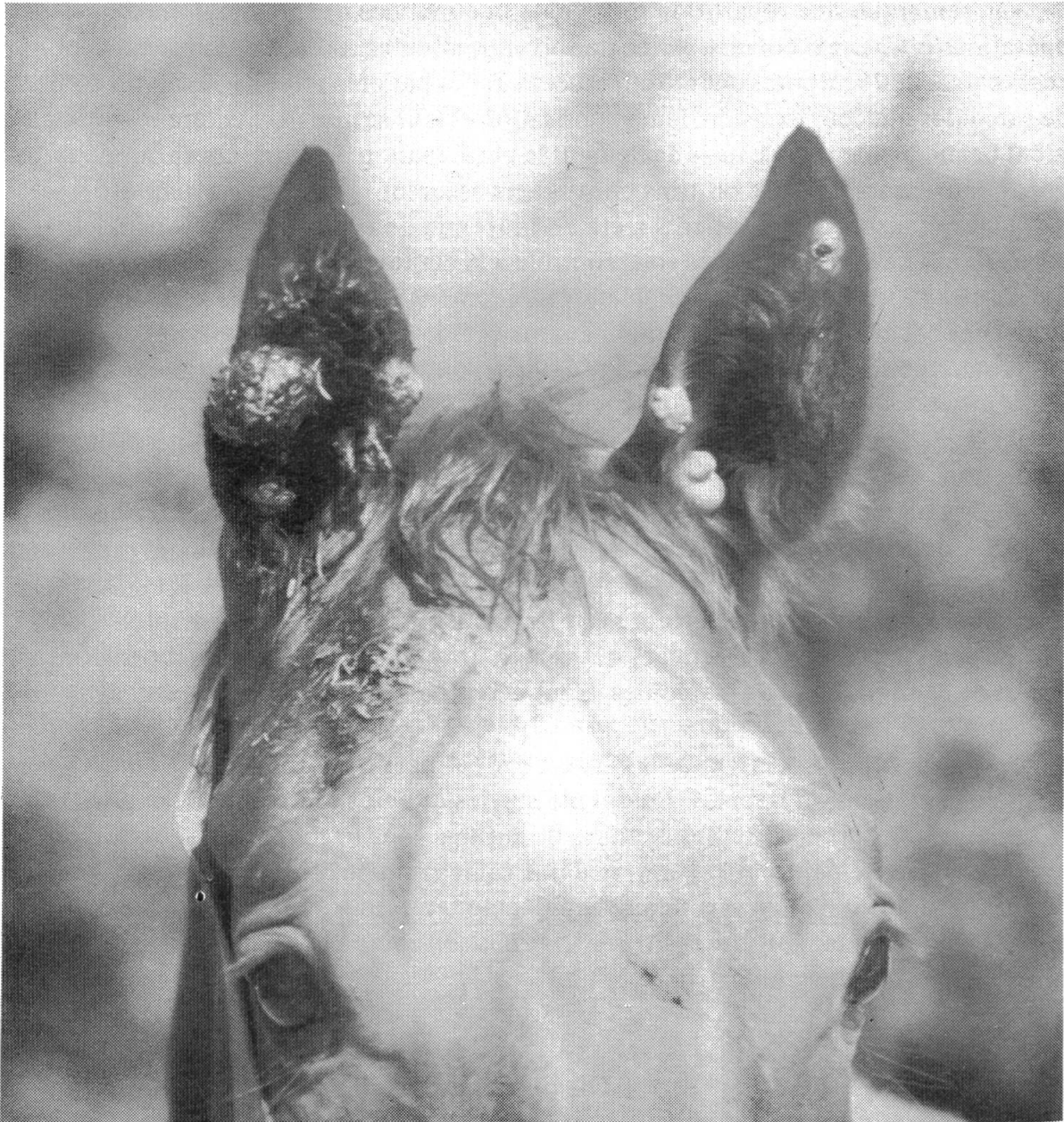
Fig. 2 Exemple de sarcoïde aux oreilles avant traitement au laser (ce cheval a été traité en pratique par différentes méthodes avant)

âge, alors que les chevaux importés sont sélectionnés par l'acheteur à un âge moins susceptible.