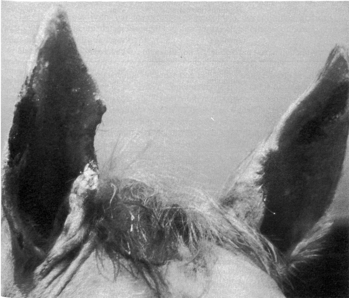
Fig. 3 Aspect le jour après chirurgie au laser: vaporisation à l'intérieur de l'oreille gauche; excision et vaporisation au bord extérieur de l'oreille droite; excision, vaporisation et suture aux bords intérieurs des deux oreilles

Le recensement de la localisation des sarcoïdes nous offre un classement des sites de prédilection conforme à celui déterminé par Sullins et al. (1986), à partir de l'évaluation de cinq études regroupant 662 sarcoïdes. Ainsi, la tête et les jambes prédominent très nettement toutes autres localisations, alors que les ars hébergent ces tumeurs cutanées de manière non négligeable.