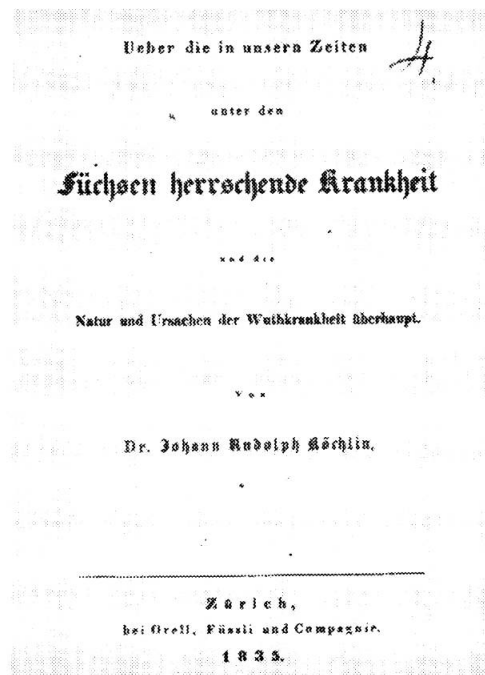
Abb. 1: Titelzeile der Arbeit von J. R. Köchlin über die Fuchstollwut, erschienen 1835 bei Orell, Füssli und Compagnie in Zürich

Von grosser Aktualität kann Köchlin's Archiv für die Schweizer Tierärzte allerdings nicht immer gewesen sein, denn er füllte seine Bogen gelegentlich mit Auszügen aus Medicinal-Berichten von Preussen und Westfalen, die ihm als Sekretär des zürcherischen Gesundheitsrates zugänglich waren. Besser schon, wenn sie das Grossherzogtum Baden betrafen! In Heft 4 des 7. Bandes, das wohl erst 1836/37 erschien, findet sich die Besprechung seiner Broschüre über die Fuchstollwut (Köchlin, 1835), eines allein schon seuchengeschichtlich interessanten Dokumentes.