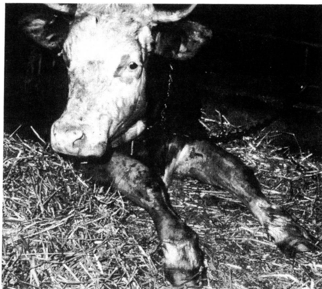
Abb. 1: Typische Haltung einer Kuh mit Entzündung der Karpalgelenksstrecker im Liegen

Den kennzeichnenden Befund liefert die Palpation, am besten am stehenden Tier. Beim gesunden Rind sind dann die Karpalgelenksex tensoren, insbesondere der Musculus extensor carpi radialis mitsamt seiner Sehne, entspannt, locker, nicht druckempfindlich und sowohl gegenüber dem Knochen (Radius) als auch gegenüber der Haut verschieblich. Bei Tieren mit Karpalgelenksstrecker-Entzündung