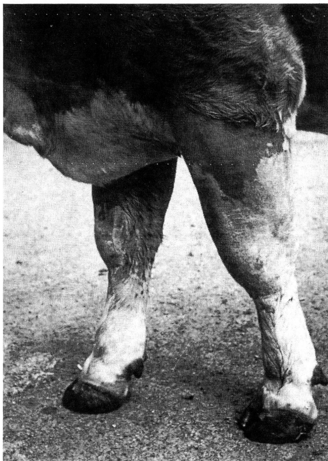
Abb. 2: Umfangsvermehrung am Unterarm bei einer Kuh mit Entzündung der Karpalgelenksstrecker