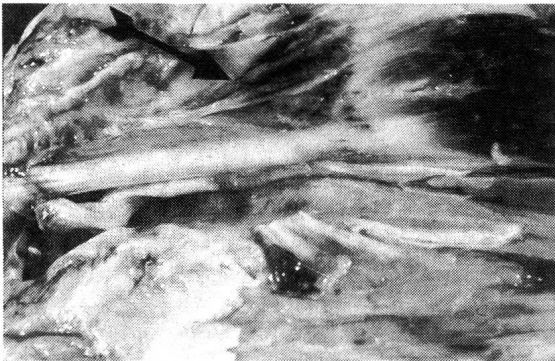
Abb. 4: Subakute granulierende Entzündung der Sehnenscheide des Musculus extensor carpi radialis (fibroplastische Organisation von fibrinösem Exsudat). DFV-Kuh, 3 J.

fibrinöse Exsudat. Im Granulationsgewebe sind herdförmig lymphohistiozytäre Zellansammlungen und Gruppen von mit Hämosiderin beladenen Makrophagen nachweisbar.