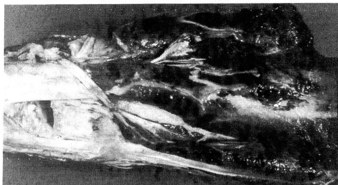
Abb. 3: Subakute, mit Fibrinexsudation und Hämorrhagien einhergehende Entzündung im Bereich des distalen Abschnittes des Musculus extensor carpi radialis, seiner Fascie und des Übergangs in seine Endsehne. DfV-Kuh, 3 J.

Pathomorphologische Befunde: Jeweils in den distalen muskulären Anteilen des M. extensor carpi radialis und manchmal, dann aber geringer ausgeprägt, des M. extensor digitorum communis sowie des M. abductor digiti I longus fällt eine ödematös-hämorrhagische Infiltration des Gewebes auf. Die Fascie des M. extensor carpi radialis ist schwartig verdickt. Die Endsehne dieses Muskels lässt klare Konturen vermissen. Ihre Sehnnenscheide ist ebenfalls verdickt und enthält hämorrhagisch-fibrinöses Exsudat (Abbildung 3), das durch sulzig-schwieeliges Granulationsgewebe in Organisation begriffen ist. Die Sehne und ihre Sehnnenscheide sind teilweise durch zottiges und Spalträume aufweisendes Granulationsgewebe miteinander verbunden (Abbildung 4).