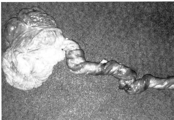
Abb. 3: Makroskopische Darstellung einer Nabelstrangtorsion.

Sauerstoffmangel verdeutlicht. Sämtliche dieser Fohlen wurden zwischen dem 7. und 8. Trächtigkeitsmonat abortiert.