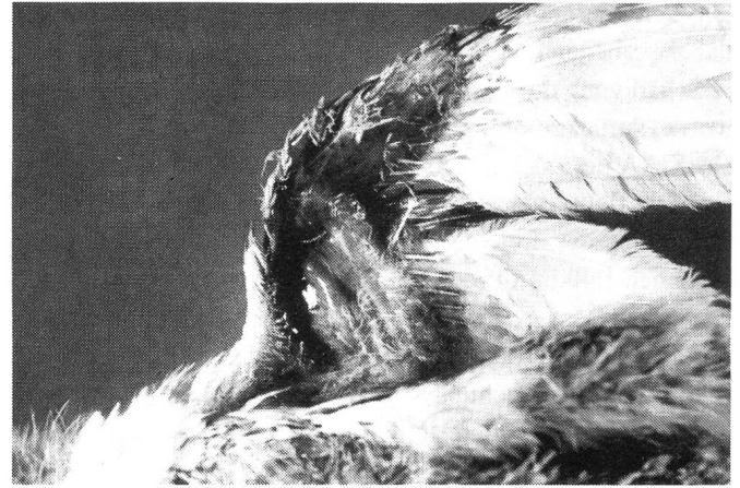
Abb. 2: CAA-infiziertes 16tägiges Mastkükens mit sog. Blauflügelkrankheit (Blue wing disease)

disease; Abb. 2) diagnostiziert. Bei 2 (1,0%) Mastkükens einer Herde wurde histologisch eine Einschlusskörperchen-Hepatitis gefunden.