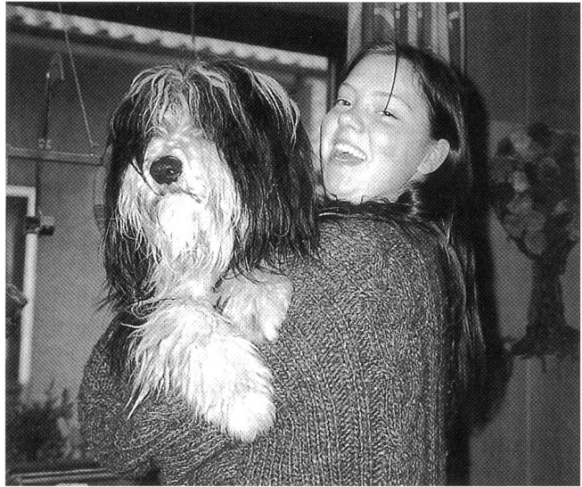
Abb. 2: Den Hund liebevoll «in den Arm nehmen»; durchaus Normalverhalten bei vielen Hundebesitzern (Photo: Dr. K. Neurand).

Liegt aber tatsächlich eine Form der Verachtung des Mitmenschen vor, so sollte man differenziert bedenken, wen oder was man dafür verantwortlich macht. Immer noch, aber unbewiesen, «wird der Vorwurf nicht der Liebes-