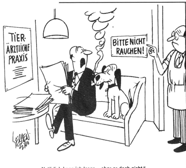
„Nat rlich kann ich lesen - aber er doch nicht.“

On esp re que nos confr res fran ais feront bon usage de ces conseils !